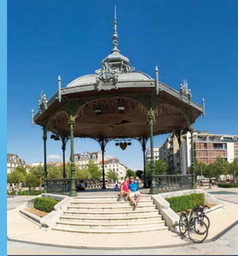
La Région vous transporte

L : lundi M : mardi Me : mercredi J : jeudi V : vendredi S : samedi DF : dimanche et fêtes